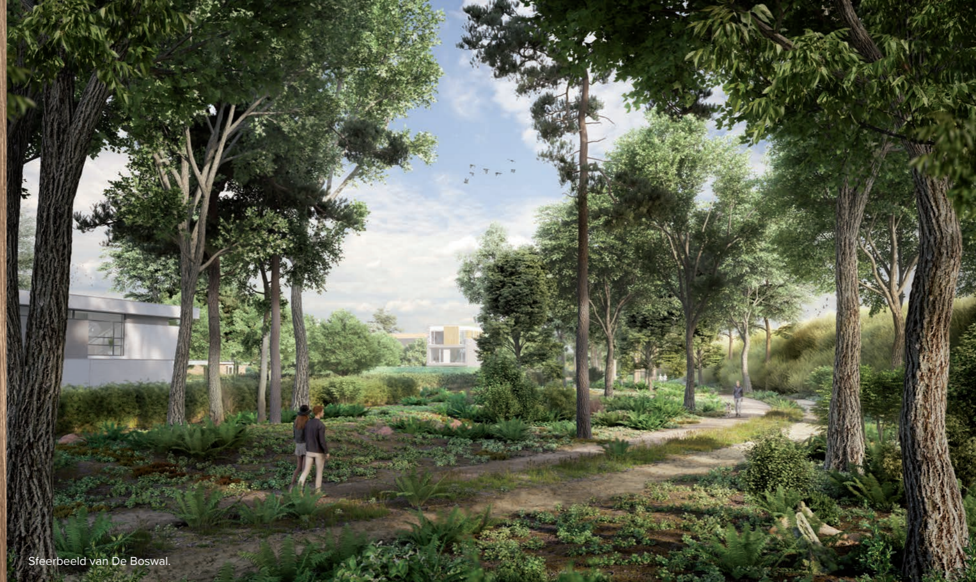
Sfeerbeeld van De Boswal.